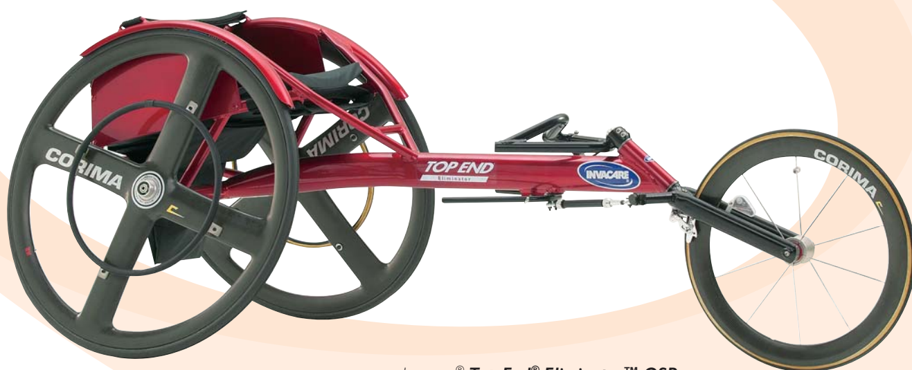
Invacare ® Top End ® Eliminator ™ OSR

Le fauteuil Invacare ® Top End ® Eliminator ™ OSR est entièrement conçu pour la performance, permettant d'optimiser le potentiel de chaque athlète. Avec son châssis-poutre horizontale couplé à un nouvel angle du tube de direction pour plus de stabilité et d'aérodynamisme, c'est un fauteuil d'exception.