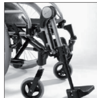
MB 16 Repose jambes

* Pour tout autre modèle d'accessoires, veuillez vous reporter à la page 165 du catalogue.