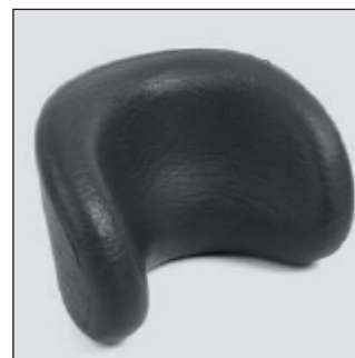
MZ 53 Appuie-tête*