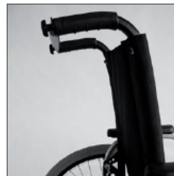
MD 10 Dossier inclinable rabattable sur l'assise avec tendeur de dossier