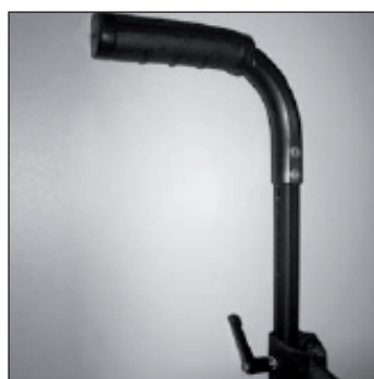
MD 52 Poignées réglables en hauteur

Indications sans le coussin d'assise par 0° d'inclinaison d'assise. Inclinaison d'assise maximale s'élève à 3,5 cm.