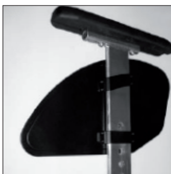
ME 03 Accoudoirs amovibles, réglables en hauteur