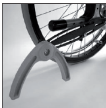
MA 62 Anti bascule pendulaire