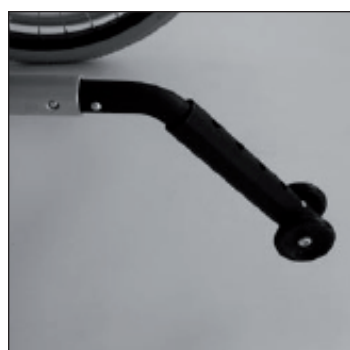
MA 55 Anti bascule simple