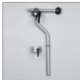
MZ 55 Set de montage Appuie-tête*